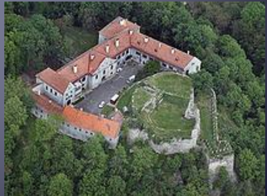
Modrý Kameň, romantická záhrada